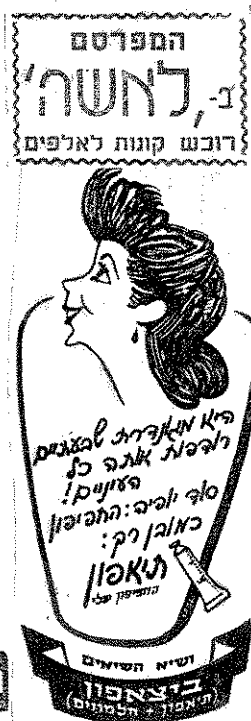
המודעות של פעם ב"לאשה", לרבות מודעה עצמית. התפוצה נמדדה אז באלפים. כיום מדובר בהרבה רבבות